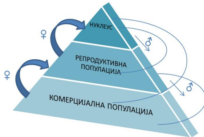
Схема 2. Структура популације