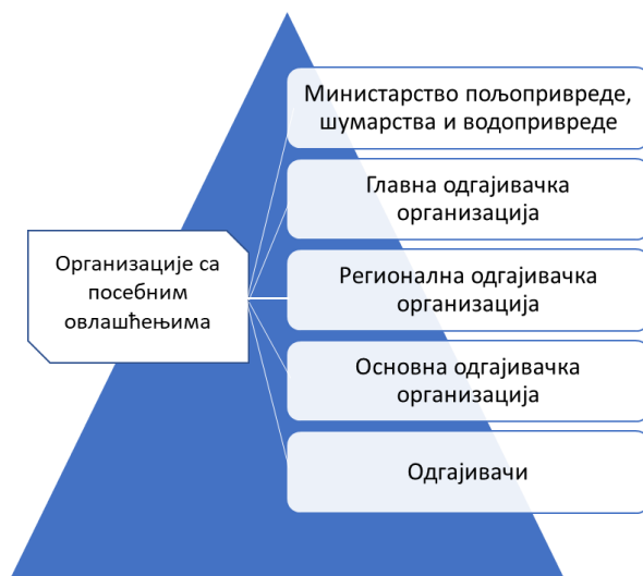
Схема 1. Организацијска структура субјеката

Однос појединих субјеката у извођењу Програма приказан је схематски: