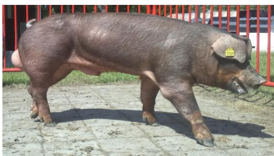
Слика 1. Нераст расе дурок

веома чврсте ноге јаке и крупне кости, стрме ставове ногу па је зато погодна и за одгој на пашњацима. Дурок је велике конституције, има добру дужне и спада у групу изузетно меснатих раса. Доста је отпорнији од осталих меснатих раса. Боја дурока је црвена са свим нијансама од светле до тамноцрвене што омогућава добру аклиматизацију у тропским пределима. Због пигментиране боје коже и длаке, дурок је односу на беле племените генотипове свиња мање осјетљив на сунчево зрачење и тиме погоднији за ситем држања свиња на отвореном.