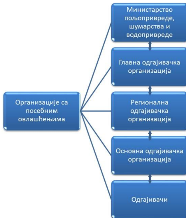
Схема 1. Организацијска структура субјекта

Овај Програм је националног карактера и у функцији је унапређења свињарства, а његовим спровођењем се постижу одгајивачки циљеви, као и контрола производних и других особина свиња. Његово спровођење унутар појединих популација свиња у Србији захтева детаљну разраду организационих, техничких и технолошких поступака. Овај Програм је подложен допунама, изменама и усаглашавањима са сличним програмима у области свињарске производње.