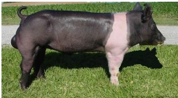
Слика 1. Нераст расе хемпшир

обухвата цело тело, као и грла која имају белу боју на глави (сем врха њушке) или на задњим ногама вишље од скочног зглоба.