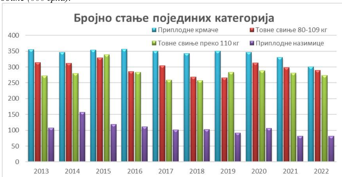
Графикон 1: Бројно стање појединих категорија свиња у Републици Србији од 2013. до 2022. године (000 грла).

На графикону 1. приказано је бројно стање појединих категорија свиња у Републици Србији од 2013. до 2022. година (000 грла).