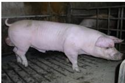
Слика 2. Нераст расе ландрас

Глава је средње дуга, лака, ширира у чеоном делу, са средње дугим и према напред повијеним ушима. Врат је средње дуг, танак и мишићав добро повезан са трупом.