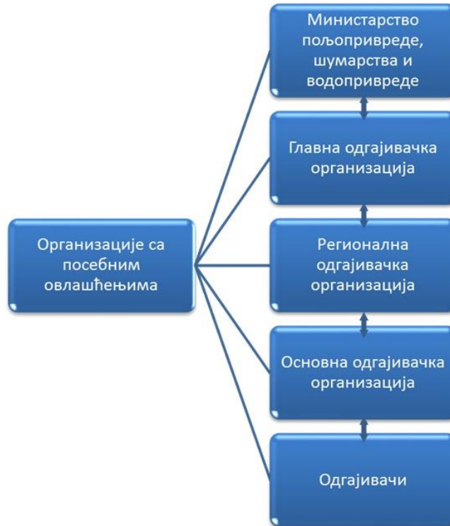
Схема 1. Организацијска структура субјекта

Овај Програм је националног карактера и у функцији је унапређења свињарства, а његовим спровођењем се постижу одгајивачки циљеви, као и контрола производних и других особина свиња. Његово спровођење унутар појединих популација свиња у Србији захтева детаљну разраду организационих, техничких и технолошких поступака. Овај Програм је подложен допунама, изменама и усаглашавањима са сличним програмима у области свињарске производње.