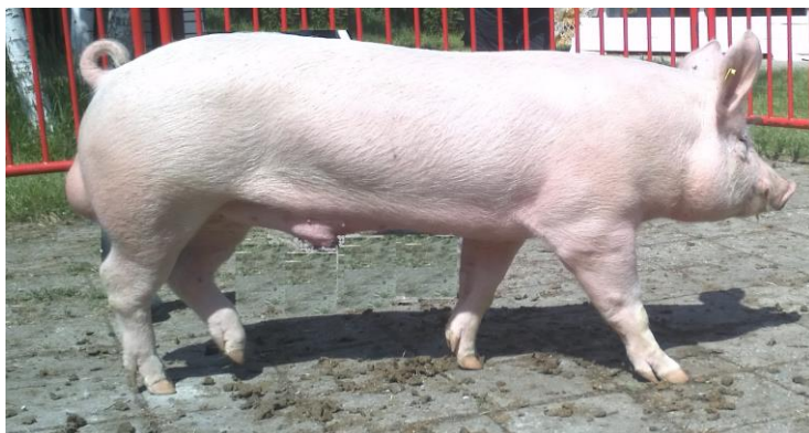
Слика 1. Нераст расе велики јоркшир

оивичене са ресама нежних длака. Врат треба да је дугачак, широк и јак, и у сразмери са ширином рамена. Грудни широке и дубоке, леђа равна и не сувише широка. Леђа морају бити дугачка, равна и широка од врата до крста, реп високо насађен, дуг, са кићанком нежних длака. Слабине треба да буду дубоке, ребра гупка, трбух затегнут, а бутони добро попуњени и да се спуштају дубоко према скочном зглобу. Ноге морају бити равне и добро постављене у ширини тела, кичице кратке и гупке, папци чврсти и крупни. Модерни селекционисан тип великог јоркшира има средње високе ноге снажних костију. Постоје селекције јоркшира који имају испупчену леђну линију. Дуж трбушне линије крмаче имају 7-8 пари правилно распоређених сиса које су добро развијене. Танка и непигментирана кожа прекривена је белом и ретком чекињом.